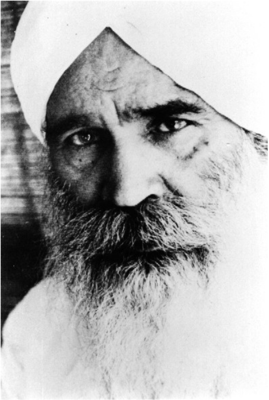
Sant Kirpal Singh